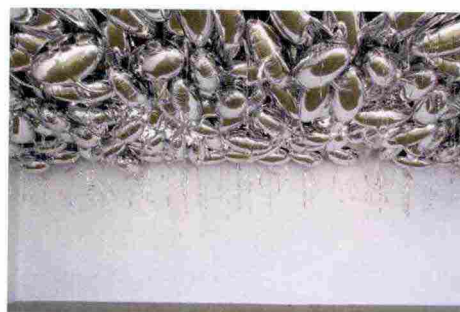
Philippe Parreno, 'Speech Bubbles (Silver)', 2009

Installazioni a Versailles – Sempre più aperto all'arte contemporanea, il castello accoglie fino al 30/10 Olafur Eliasson. 5 opere in interni, per cambiare le prospettive degli spazi barocchi, 3 nel parco sul tema dell'acqua, compresa la monumentale 'Waterfall'. www.chateauversailles.fr