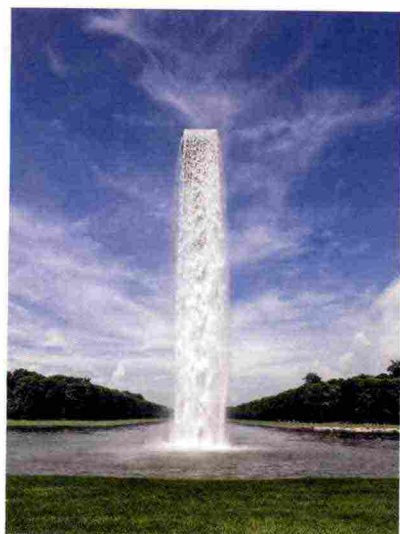
Olafur Eliasson, 'Waterfall', 2016, Palais de Versailles