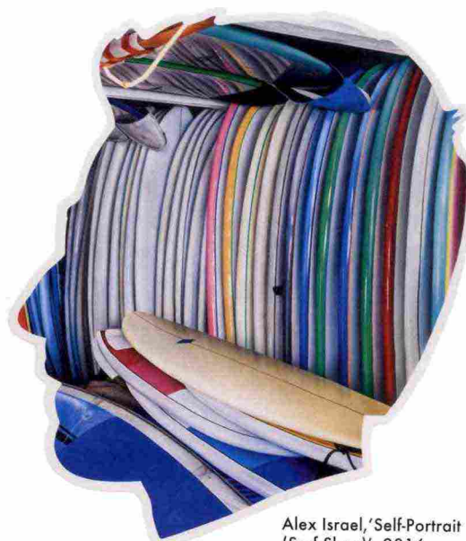
Alex Israel, 'Self-Portrait (Surf Shop)', 2016